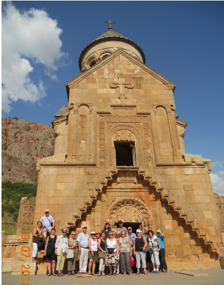
Photographie du groupe devant l'église de Noravank

bien sûr, que quelques-uns de ces lieux, mais nous pouvons vous assurer que nous avons trouvé l'Arménie en plein essor, bien vivante et les Arméniens merveilleux !