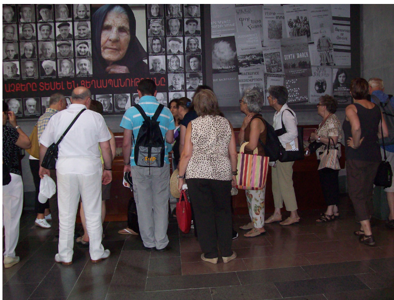
Visite du Musée du Génocide à Erevan

Sur la route du lac Sevan, nous faisons une halte savoureuse à Gavar dans une entreprise artisanale de lavash et de bakhlava, avec moult démonstrations et dégustations pour le bonheur de tous !