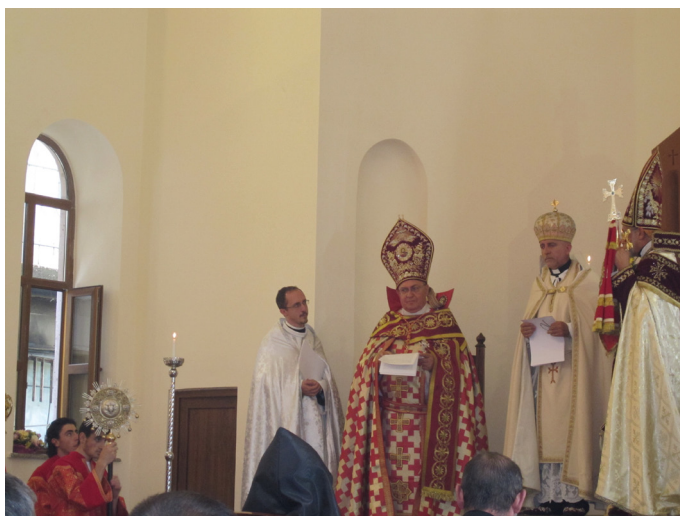
S. Em. Le Cardinal Leonardo Sandri vêtu des ornements liturgiques arméniens