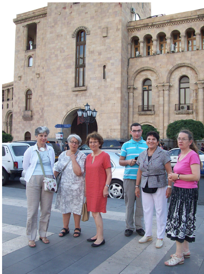
Quelques voyageurs sur la place de la République à Erevan

Le monastère fortifié de Khor Virap est situé sur la citadelle de la ville antique d’Artachat, qui veut dire “joie d’Artachès”. En 190 avant Jésus-Christ, Artachès déclara son indépendance vis-à-vis des Séleucides et de Rome. En recourant aux services d’Hannibal - le pire ennemi de Rome - qui se trouvait en Anatolie, Artachès marquait son autonomie et, avec les conseils stratégiques de ce dernier, Artachat fut construite au bord de l’Araxe sur une superficie de plus de 500 hectares. Elle devint la capitale de l’Arménie pendant cinq siècles. Située sur la route de la soie, Artachat était un carrefour entre l’Orient et l’Occident. Elle fut détruite et reconstruite à plusieurs reprises. C’est sur ce site qu’est édifié le monastère de Khor Virap.