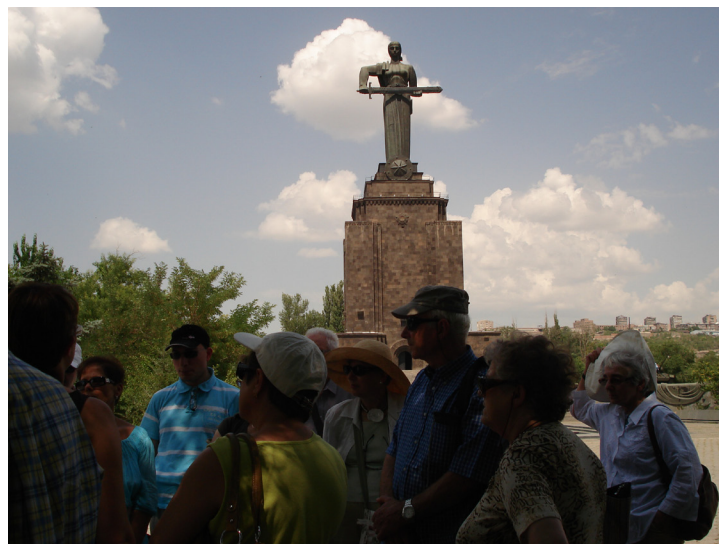
Devant la statue de la Mère Arménie

Nous arrivâmes à Stepanakert, la capitale, où vit une part importante de la population. On n'y trouve plus guère de traces de la guerre et de nombreux bâtiments ont été reconstruits. Notre hôtel, situé à côté du Parlement, un bâtiment surmonté d'une armature en forme de coupole rappelant les coupoles traditionnelles des églises arméniennes, est aussi face à la Présidence de la République et très animé, l'élection présidentielle se tenant le lendemain 19 juillet.