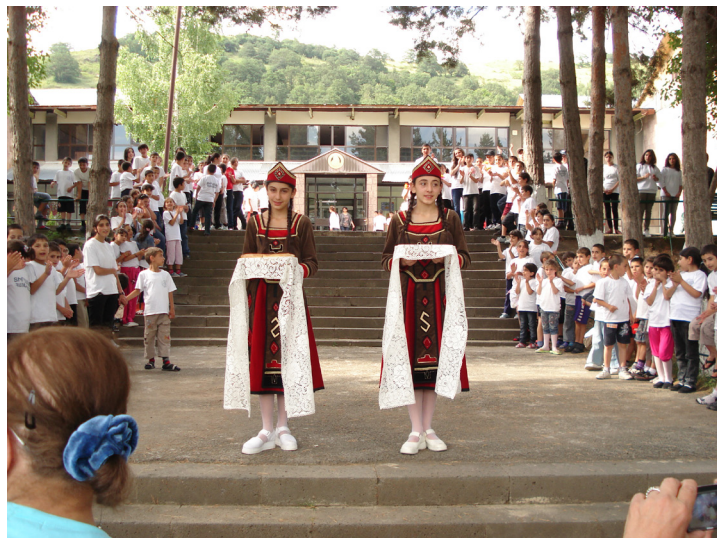
À l'entrée de la colonie de vacances de Sœur Arousiag, deux jeunes filles présentent le pain et le sel que les hôtes coupent et mangent avant de gravir les marches

Le dernier jour, temps libre à Erevan. Certains d'entre nous firent les allées du « Vernissage » de long en large et en rapportèrent bijoux, instruments de musique, livres, tableaux ou antiquités ; d'autres allèrent au « Tachir », le marché d'épices, de fruits et légumes (un petit colis d'abricots trouva ainsi sa place dans une valise) ; d'autres empruntèrent l'avenue Mesrop Machtotz pour pénétrer dans le sanctuaire des précieux manuscrits et livres du Maténadaran où figure l'inscription «Connaitre sagesse et instruction, Comprendre les paroles de l'intelligence». Et, pour clore l'initiation gastronomique de ce séjour, nous eûmes droit à une «lahmadjoun party» !