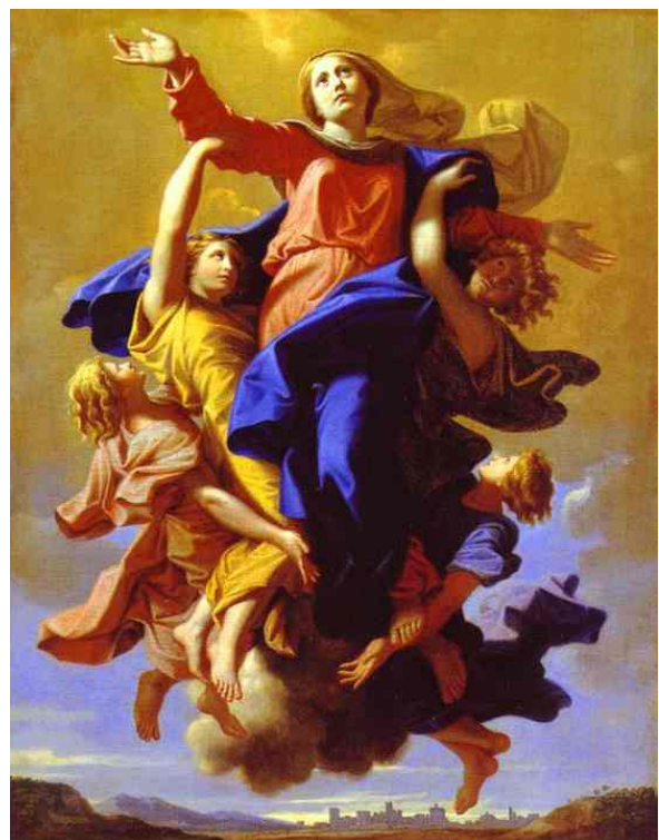
Nicolas Poussin, Assomption de la Vierge Marie , 1650, Paris, Musée du Louvre

Toi, Notre-Dame, consolide en nos cœurs la foi et l'espérance et remplis-nous de cet amour qui vaincra toute mort le jour de notre propre assomption.